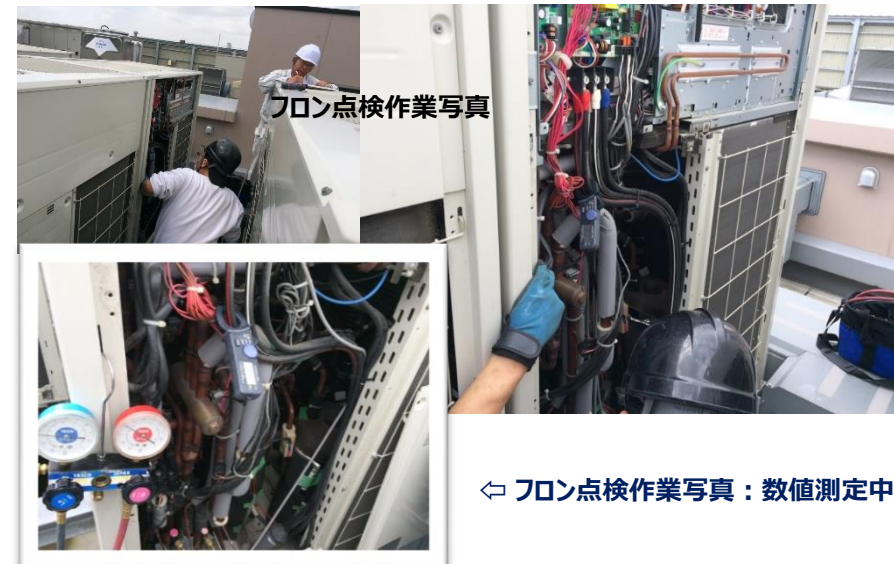
⇐ フロン点検作業写真：数値測定中